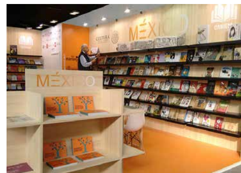
Stand de México en Bolonia.

Los organizadores de la Feria del Libro de Bolonia anunciaron que el país invitado para el 2018 será China.