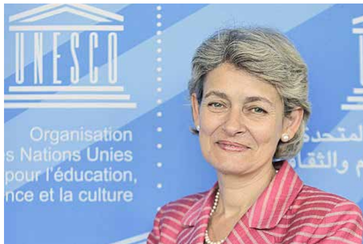
Irina Bokova, directora general de la Unesco.

Dicen que el modo en que una sociedad trata a sus miembros más vulnerables es lo que permite medir su grado de humanidad. Cuando aplicamos esta reflexión a la disponibilidad de libros para personas con discapacidad visual, o con discapacidades físicas o de aprendizaje (provocadas por distintas causas), nos enfrentamos a un fenómeno que solo puede describirse como “hambruna de libros”.